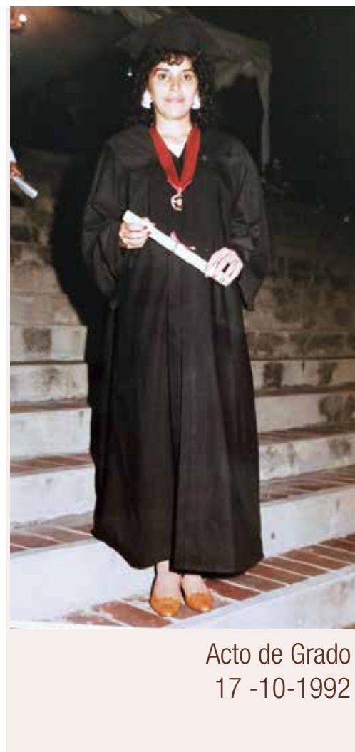
Acto de Grado 17 -10-1992

Sabiendo el abanico de opciones que ofrece el ejercicio profesional de la Contaduría Pública en cuanto a las áreas donde me podía desempeñar, mantuve siempre la actualización profesional permanente, realizando cursos y talleres relacionados con la profesión. En relación con esta iniciativa, destaco muy especialmente, la realización del COMPONENTE DOCENTE , a través del Programa Sistema de Actualización e Innovación del Ejercicio Docente para profesores de Educación Superior realizado en la Universidad de Oriente, Vicerrectorado Académico, en Cumaná. Edo. Sucre, en 2004/2005.